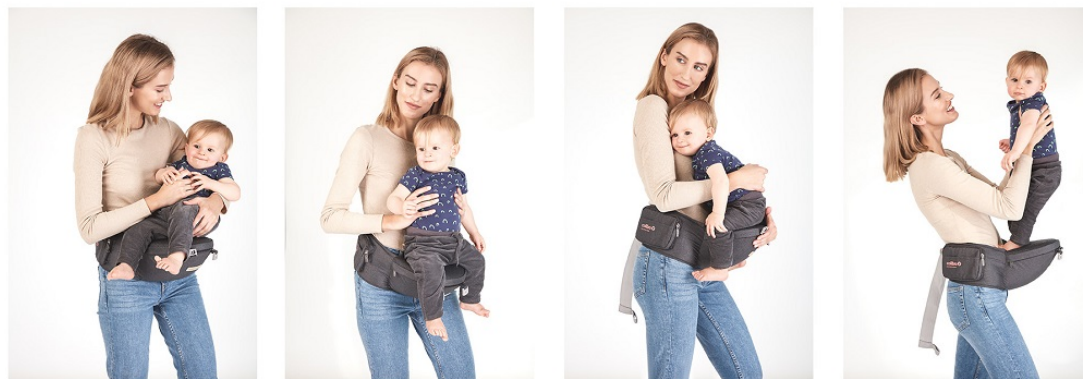
4 UŁOŻENIA NA SAMYM SIEDZISKU BIODROWYM