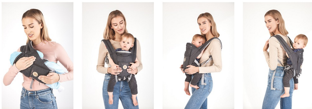
4 UŁOŻENIA W NOSIDEŁKU ERGONOMICZNYM