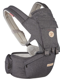
NOSIDEŁKO ERGONOMICZNE + SIEDZISKO BIODROWE