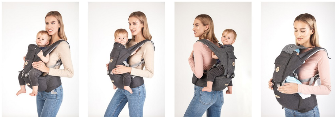
4 UŁOŻENIA W NOSIDEŁKU ERGONOMICZNYM Z SIEDZISKIEM BIODROWYM