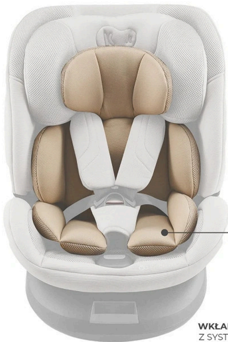
WKŁADKA ERGO PAD+ Z SYSTEMEM AIR FLOW DLA DZIECI DO 75 CM